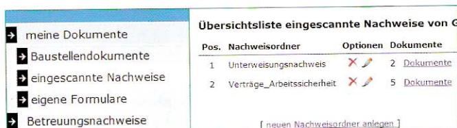
Infobox: eingescannte Nachweise

Mit den neuen Rubriken „Baustellendokumente“ und „eigene Formulare“, kann der Nutzer gescannte Dokumente oder eigene Dateien (Fotos, Protokolle, Formulare) hochladen, die er online nutzen möchte. Die Sortierung nach Dokumenttypen erhöht die Übersicht in den einzelnen Ordnern. Der nachfolgende Ausschnitt aus der Webseite von basik-net zeigt eine neue und sehr nützliche Funktion.